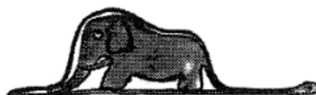
Zeichnung Nr. 2